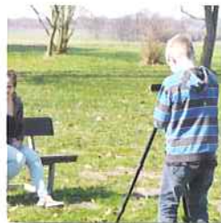
Die Szene ist im Kasten